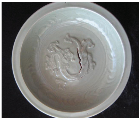
Đĩa trang trí hình rồng trong lòng

Đồ gốm men ngọc có các loại hình gồm: đĩa, bát, lư hương, chén, tước và lọ. Trong đó đáng chú ý loại đĩa có kích thước 32- 34 cm; dáng chậu miệng loe ngang, thành trong in lõm bằng cánh hoa cúc, dưới đáy phủ men để lại dấu bàn kê hình vành khăn. Đặc biệt hơn có loại đĩa trang trí nổi hình rồng mang đặc trưng nghệ thuật thế kỷ 13.