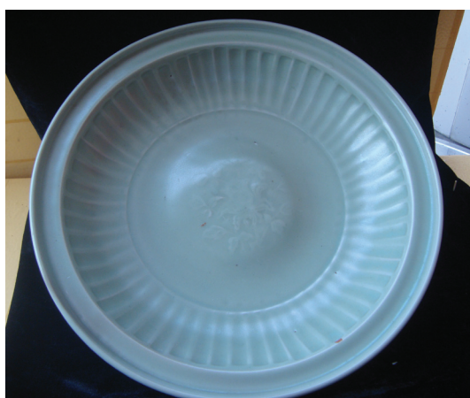
Đĩa trang trí hoa cúc trong lòng

Loại lư hương nhỏ có miệng tròn, thân hình trụ có gắn 3 chân nổi. Men ngọc có màu xanh da táo, màu vàng chanh, oliu, trắng đục với nhiều sắc độ khác nhau. Loại bát men ngọc có miệng loe, thành cong, đế thấp, đáy mộc khá phổ biến. Loại này xuất hiện từ khoảng 3 đến khoảng 12. Ngoài ra, các loại khác như tước, lọ 2 tai nổi có số lượng ít. Nhưng các loại hình này cũng mang đặc trưng gốm men ngọc thế kỷ 13.