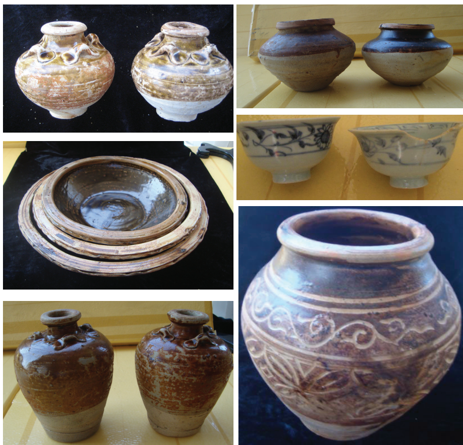
Một số loại hình đồ gốm khác khai quật trong tàu đắm Bình Châu