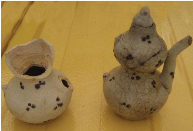
Ấm hai bầu