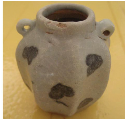
Lọ hai tai trang trí hoa bèo