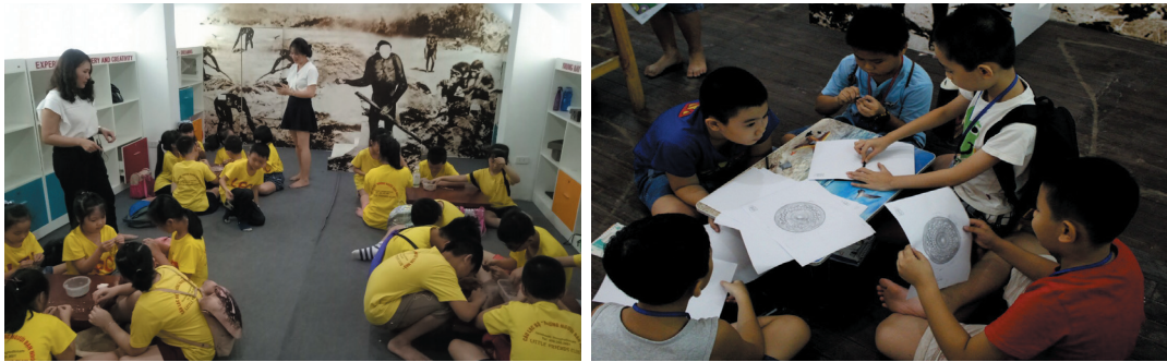
Hoạt động giáo dục: Trải nghiệm Xâu hạt chuỗi thời Tiên sử và In hoa văn Trống đồng tại phòng Khám phá, Bảo tàng Lịch sử Quốc gia

Tại Bảo tàng Lịch sử Quốc gia, 5 năm trở lại đây, các chương trình giáo dục thông qua mô hình Câu lạc bộ “Em yêu lịch sử” và “Giờ học lịch sử” được tổ chức thường xuyên, liên tục tại Bảo tàng, diễn ra trong cả năm học lẫn kỳ nghỉ hè của các em học sinh. Các chương trình được xây dựng trên cơ sở bộ sưu tập hiện vật quý giá của Bảo tàng, gắn kết chặt chẽ với chương trình trong sách giáo khoa (chủ yếu là môn Lịch sử) của học sinh từng khối lớp và được thiết kế thường chỉ dành cho từng nhóm nhỏ từ 20 đến 25 em. Tham gia chương trình, học sinh được trải nghiệm, tương tác, trao đổi, thảo luận, rèn luyện các kỹ năng kết hợp vận động thể chất và thể hiện tài năng sự sáng tạo của mình qua các hoạt động học mà chơi, chơi mà học. Sự hấp dẫn, bổ ích mà mỗi chương trình giáo dục tại Bảo tàng Lịch sử Quốc gia đã thu hút đông đảo các em học sinh đến từ khối các trường Tiểu học, THCS, THPT và các nhóm gia đình trên địa bàn Hà Nội. Trong 3 năm: 2017, 2018, 2019 có 1.005 chương trình giáo dục đã được thực hiện với sự tham gia của 44.090 học sinh tại Bảo tàng Lịch sử Quốc gia đã phần nào nói lên sức hấp dẫn, thành công của hoạt động giáo dục bảo tàng.