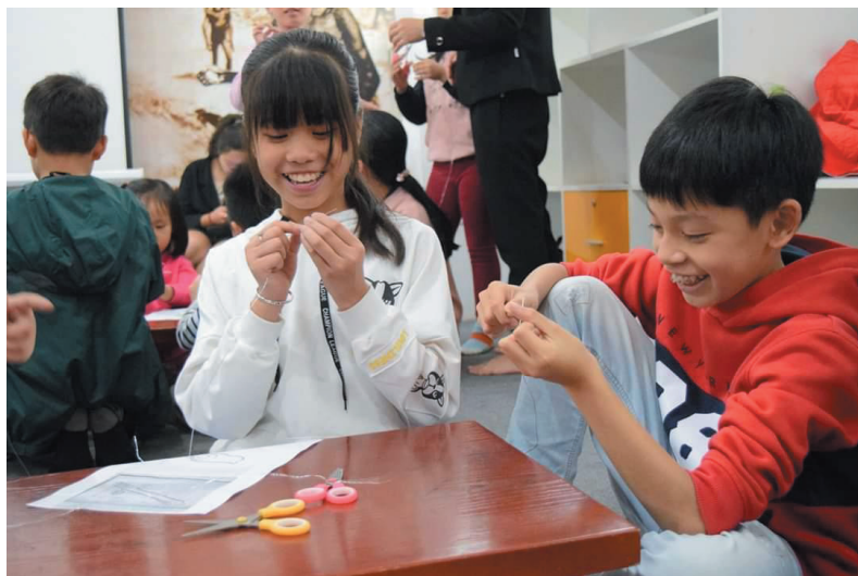
Học sinh tham gia hoạt động Tìm hiểu tính dẻo của kim loại trong Chương trình giáo dục chủ đề “Kim loại - Tinh hoa văn hóa Đông Sơn - Khám phá dưới góc nhìn khoa học” tại phòng Khám phá, Bảo tàng Lịch sử Quốc gia, 5/2019

tham quan bảo tàng. Theo Hiệp hội Bảo tàng Anh thì việc giáo dục, học tập trong bảo tàng là: “Học tập là một quá trình chủ động trải nghiệm. Đó là việc con người thực hiện khi họ muốn tìm hiểu về thế giới. Nó có thể bao gồm việc phát triển hoặc đào sâu về kỹ năng, kiến thức, sự hiểu biết, nhận thức, giá trị, ý tưởng và cảm xúc, hoặc tăng cường khả năng suy nghĩ. Học tập có hiệu quả dẫn đến sự thay đổi, phát triển và khao khát học hỏi thêm nữa” *