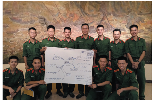
Chương trình “Giờ học lịch sử” của các học viên Trường Đại học Chính trị tại Bảo tàng Lịch sử Quốc gia, tháng 4/2019