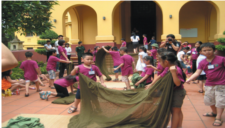
Hoạt động: Em là chiến sĩ nhỏ trong một “Giờ học lịch sử” tại Bảo tàng Lịch sử Quốc gia

- Vài thập kỷ gần đây, bảo tàng bị đặt vào thế cạnh tranh gay gắt với tất cả các lĩnh vực của ngành công nghiệp giải trí, từ các công viên mang tính giải trí - thương mại đến các trung tâm mua sắm cũng như giải trí tại gia đình... Điều này đã làm đảo lộn sự ổn định truyền thống của bảo tàng cũng như lượng khách đến