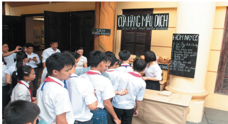
Hoạt động: Trò chuyện cùng nhân chứng lịch sử trong Chương trình giáo dục “Trải nghiệm thời bao cấp” tại Bảo tàng Lịch sử Quốc gia năm 2016

+ Tổ chức chương trình giáo dục: Trên cơ sở các hiện vật, bộ sưu tập hiện vật, nội dung trưng bày của Bảo tàng, cán bộ giáo dục nghiên cứu, xây dựng chương trình với các hoạt động ở nhiều dạng thức khác nhau nhằm mục đích khuyến khích công chúng tiếp xúc gần hơn với sưu tập hiện vật, trưng bày/nội dung