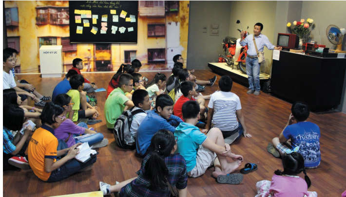
Hoạt động: Trò chuyện cùng nhân chứng lịch sử trong Chương trình giáo dục “Trải nghiệm thời bao cấp” tại Bảo tàng Lịch sử Quốc gia, 2016

- Quan điểm coi nhiệm vụ của bảo tàng là cung cấp các cơ hội học tập phục vụ công chúng cơ bản tương đồng với nội dung về Học tập suốt đời , được giới thiệu trong Báo cáo Học để làm Người* (1972) của UNESCO và đã được phát triển và công nhận rộng rãi trên thế giới. Theo Báo cáo này, việc học tập suốt đời diễn ra từ lúc nằm nôi đến khi qua đời, bao gồm học tập chính quy (formal), không chính quy (non-formal) và phi chính quy (informal). Trong đó tập trung vào ba trụ cột chính là kiến thức, kỹ năng và năng lực. Đồng thời, người học được nâng cao khả năng hành nghề, phát triển cá nhân, trở thành công dân tích cực và hòa nhập xã hội.